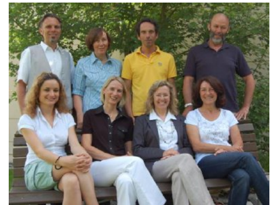
Das Team unserer Beratungsstelle

Beide Elternteile erhalten zunächst getrennt voneinander Beratungsgespräche. Im weiteren Verlauf sind meist auch gemeinsame Elterngespräche vorgesehen.